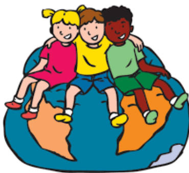
We horen bij elkaar

Het programma van de Vreedzame School biedt een programma, dat bestaat uit zes blokken. Het eerste blok heeft als thema "Wij horen bij elkaar" en bij de groepen 1/2 heet het "Onze klas". Het gaat bij dit thema over de groepsvorming. In elke klas is op het prikbord een gele wand zichtbaar met daarop de grondwet van de Vreedzame School, het vignet van het eerste thema en de opsteker (een compliment). Binnenkort komen ook de afspraken en regels van de groep daar te hangen. De afbeeldingen zijn een verduidelijking en herinnering aan alles wat we doen voor een Vreedzame School. Dat laatste, het doen, is natuurlijk het belangrijkste en daar gaan we met z'n allen aan werken.